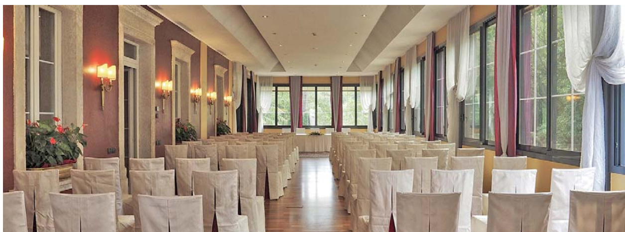
sala meeting cardinale

La valutazione progettuale ha portato alla scelta dell' Access Point CAP1750 con standard AC 1750Mbps, il Controller Hardware AC500 che, oltre che gestire ed ottimizzare il funzionamento del wireless, permette l'autenticazione degli utenti tramite rilascio dello username e password per la navigazione sulla rete ospiti. Questo servizio viene gestiti tramite il Facebook WIFI che permette all'utente di utilizzare il suo account Facebook per navigare e all' hotel di entrare a far parte del locator di Facebook Wifi che segnala direttamente agli utenti la presenza delle strutture di zona con questo servizio. Inoltre sono stati utilizzati i modelli JetStream L2+ SmartManaged, switch 24 porte PoE+ della serie T1600G .