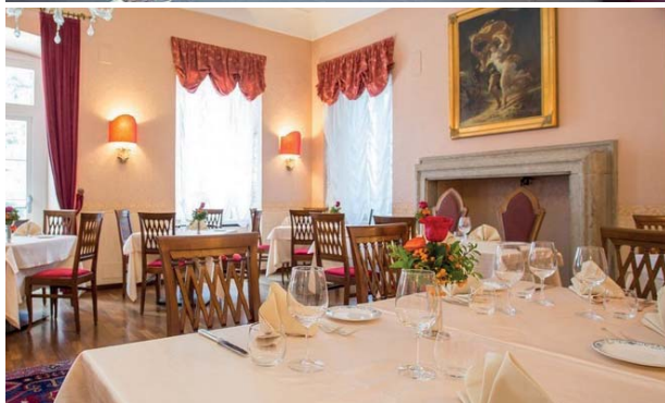
reception & ristorante